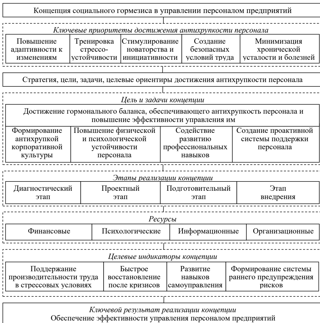
Рис. 1 / Fig 1. Содержание концепции социального гормезиса в управлении персоналом предприятий / The content of the social hormesis concept in the enterprises personnel management